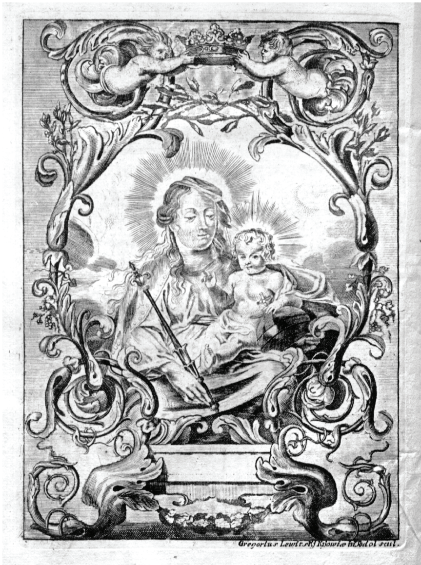
1. Богородиця з Богонемовлям. Гравюра Григорія Левицького.