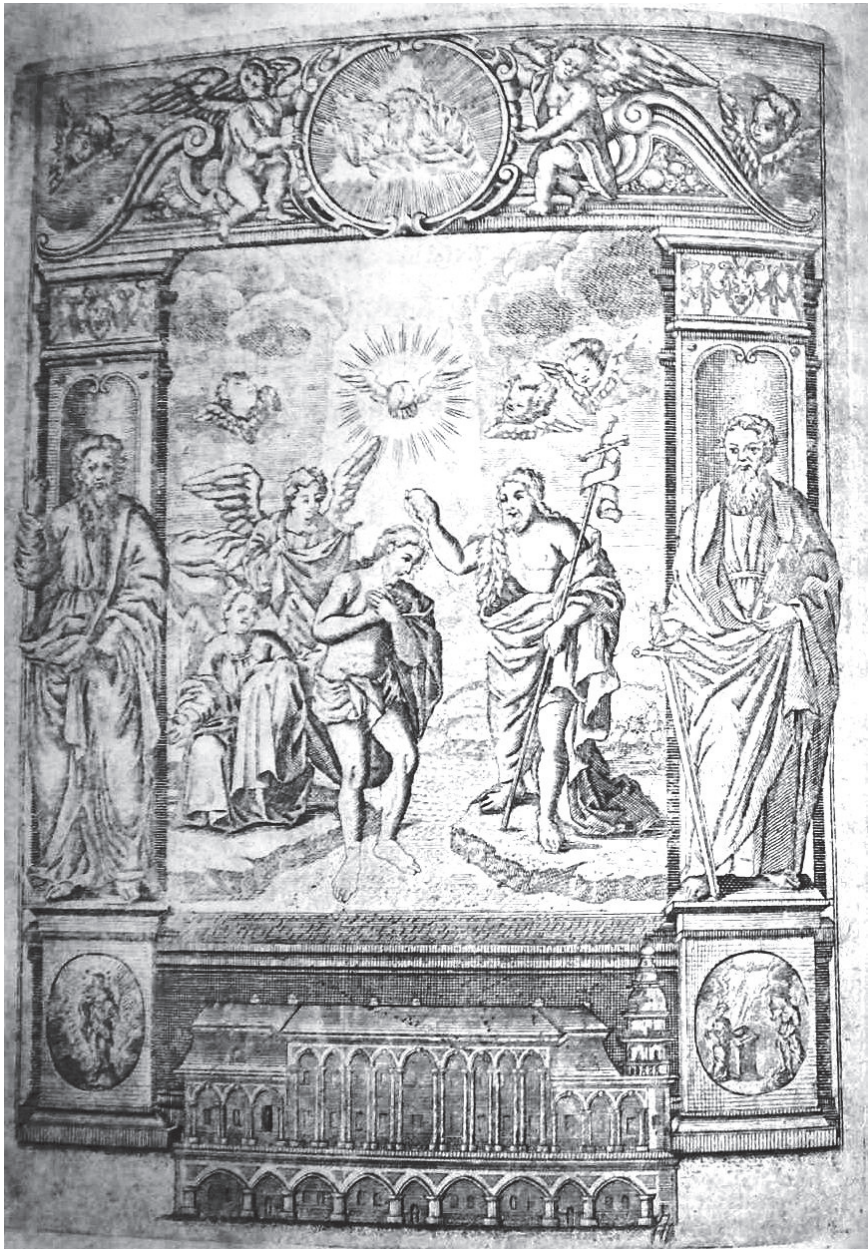
6. Гравюра Богоявлення, вірогідно, роботи Григорія Левицького.