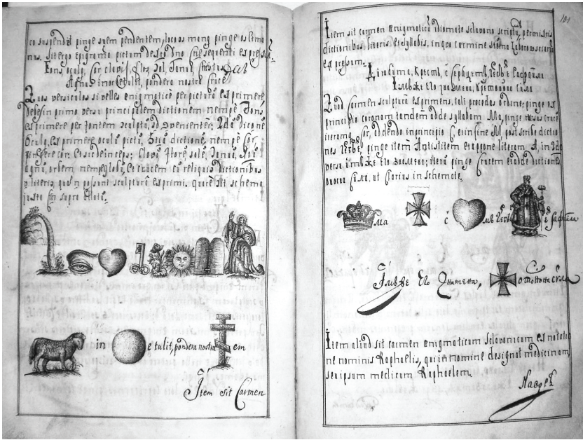
3. Аркуш «Поетики» Митрофана Довгалецького з ілюстраціями.